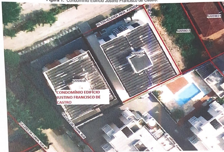
Poligonal da Av. Milton de Holanda Maia, nº 565 - Itaguá, em processo de Regularização Urbanística e Fundiária.